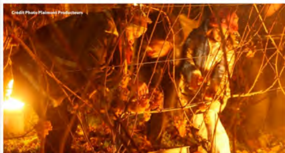
Un réveillon insolite en Gascogne au cœur des vignes de l'appellation Pacherenc du Vic-Bilh

#Gers / Parutions presse relatives au département du Gers